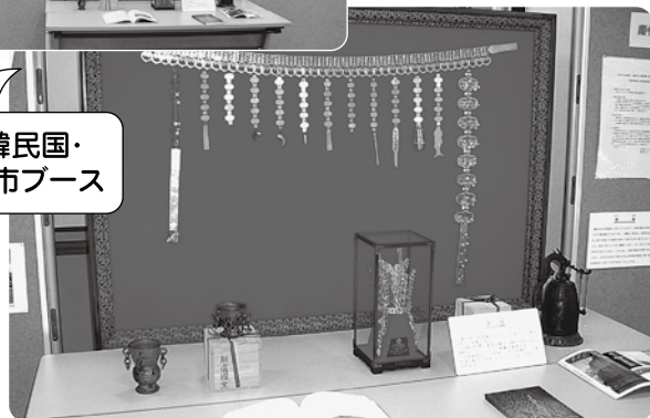
大韓民国・慶州市ブース