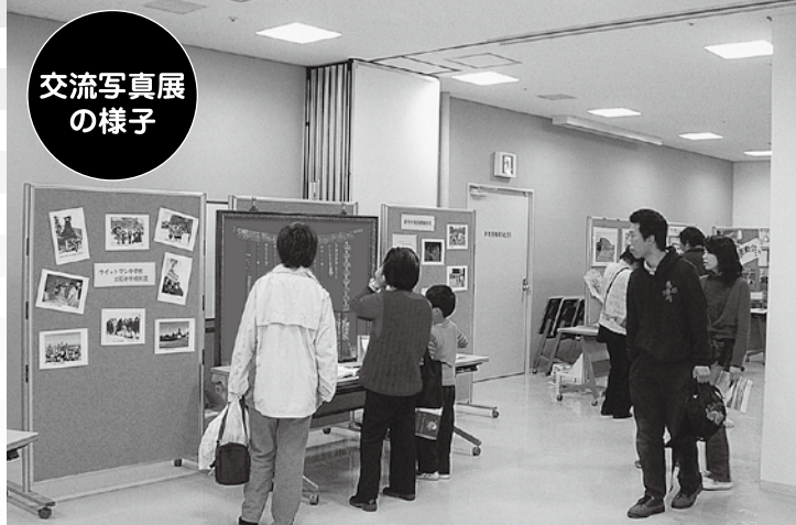
交流写真展の様子